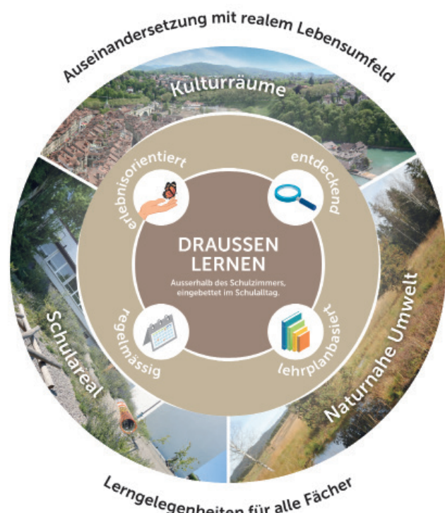
Orientierungsmodell zum Draussenunterricht

Draussenlernen kann dabei als wichtiger Bestandteil von ausserschulischen Lernanlässen aufgefasst werden, wobei der Draussenunterricht (bei einer engen Begriffsdeutung) primär Lernorte im Freien fokussiert. Wenngleich das Aussengelände einer Schule streng genommen nicht als ausserschulischer Lernort gilt, stellt es dennoch (vor allem wenn bewegungsfreundlich und naturnah gestaltet) eine naheliegende Option für das Draussenlernen in allen Fächern dar (vgl. Grafik).