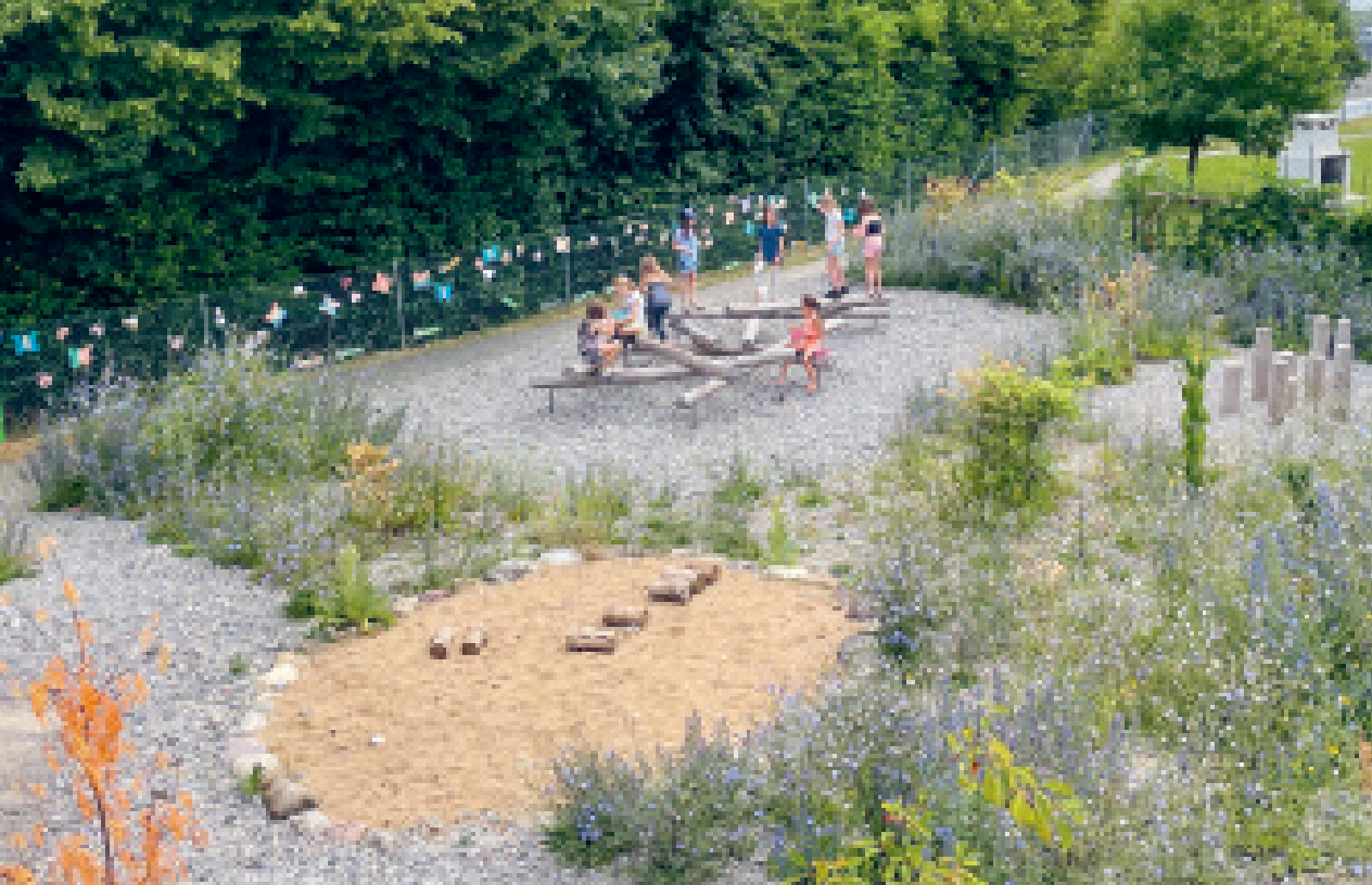
Eine lernförderliche Aussenraumgestaltung ermöglicht vielfältige Entdeckungen und Interaktionen.

Die Nutzung des schulischen Aussenraums lässt sich ohne viel organisatorischen Mehraufwand bewerkstelligen und ist im zeitlich eng strukturierten Schulalltag einfacher zu integrieren als eine Exkursion an weiter entfernte Örtlichkeiten. Aufgrund der räumlichen Nähe kann so Drinnen- und Draussenunterricht gut kombiniert werden; zum Beispiel mit einer explorativen Einstiegs- und Erarbeitungsphase auf dem Aussengelände und nachfolgenden Konsolidierung und Reflexion im Klassenzimmer. Guter Draussenunterricht ist dadurch gekennzeichnet, dass er ein Teil des Schulalltags wird und regelmässig stattfindet, bei der Erschliessung von Lernräumen entdeckende und erlebnisorientierte Zugangsweisen im Vordergrund stehen und der Lernort zum Lerngegenstand wird (von Au & Jucker, 2022). Damit diese Umsetzung vor Ort gelingt, ist eine systematische Unterrichtsplanung (analog zum Unterricht im Schulzimmer) eine wichtige Grundvoraussetzung.